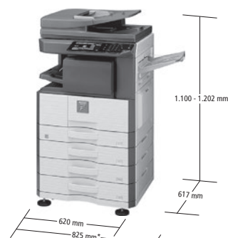
*1.085 mm con vassoio di uscita esteso. Modello con opzioni.